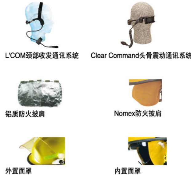
L'COM颈部收发通讯系统 Clear Command头盔震动通讯系统